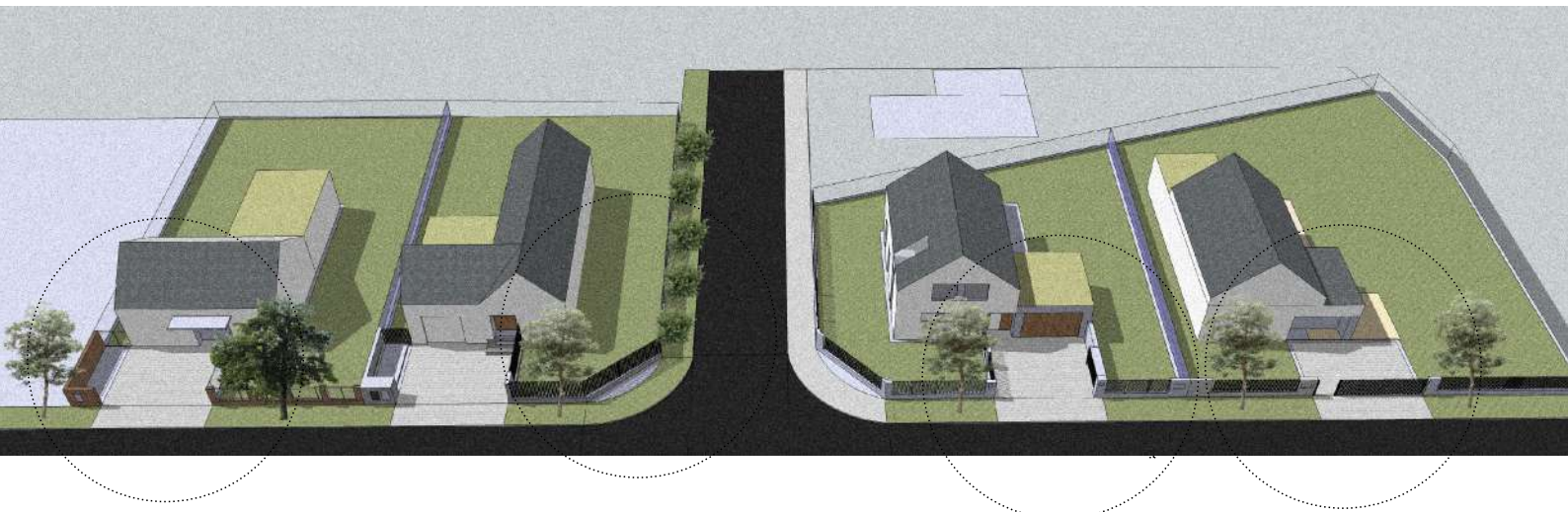
oplotenie v nárožnej polohe, pokračovanie pletiva pri zelenom páse - typ B

typ C medzi jednotlivými pozemkami - odporúčaná výška 1,8m, podľa okolností, ideálne transparentná bez vytvárania zbytočných bariér